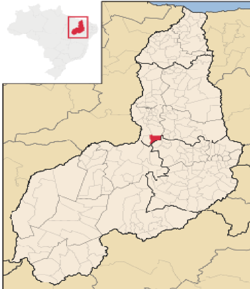
Figura 1 – Mapa de localização do município

O município de Arraial está inserido na mesorregião Centro-Norte e no Território de desenvolvimento do Vale dos Rios Piauí e Itaueira .