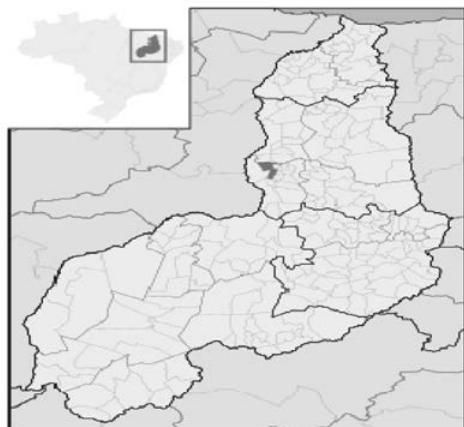
Figura 1 – Mapa de localização do município

PREFEITURA MUNICIPAL DE SÃO PEDRO DO PIAUÍ CNPJ: 06.554.810/0001-76. Av. Presidente Vargas, S/N – Centro CEP: 64.430-000 – São Pedro do Piauí Fone: (86) 3280-1549