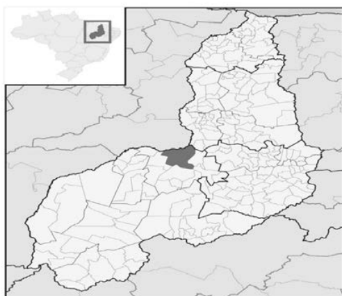
Figura 1 – Mapa de localização do município