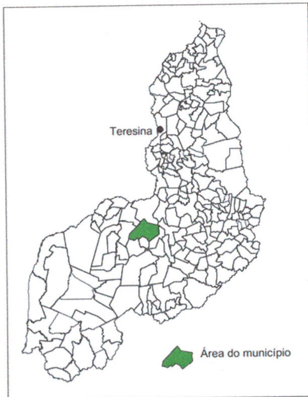
Figura 1. Mapa de Localização do Município

momento, este mandato apresenta-se ininterrupto, pois a prefeito e o seu vice, estão no comando do município.