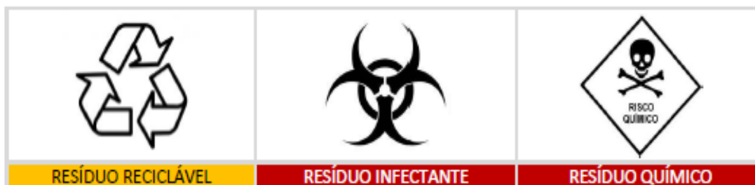
Figura 4 – Simbologia para identificação do resíduo