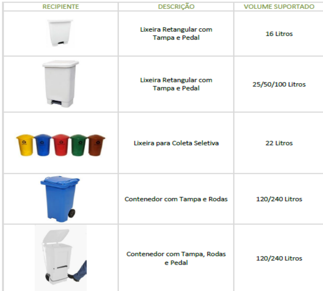
Figura 3 – Quadro de ilustrações com tipos de recipientes de coleta