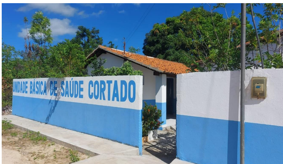
Figura 1 – UBS Cortado